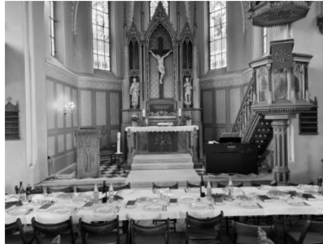
Tischabendmahl im letzten Jahr.