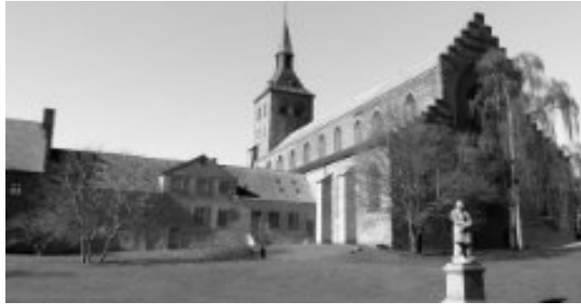
Dom St.Knud & Andersen-Statue

vielleicht gehören Sie/gehört Du auch zu denjenigen, die sich auf die Gemeindefahrt nach Odense gefreut hatten. Ich auf alle Fälle hatte mich gefreut auf ein schönes Wochenende mit Ihnen und Euch hier in der charmanten Geburtsstadt von H.C. Andersen, die seit 2 Jahren (wieder) das Zuhause von mir und meiner Familie ist. Nun hat uns die Corona-Situation erstmal einen Strich durch die Rechnung gemacht.